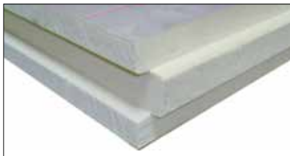
Enertherm ALU z krawędziami TG

Szytywne płyty termoizolacyjne z rdzeniem z pianki poliizocyanurowej (PIR) w okładzinach elastycznych. Stosowane jako izolacja termiczna dachów płaskich (na blasze trapezowej, betonie i deskowaniu) i skośnych (płyty ALU NF – do montażu nakrokwiowego), elewacji i ścian trójwarstwowych, posadzek (np. w mroźniach) i podłóg (płyty KR ALU – ogrzewanie podłogowe).