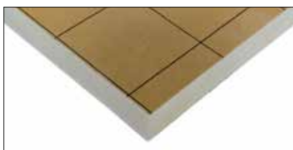
Enertherm KR ALU

* odpowiednio dla gr. 30, 40, 50, 60, 70, 80, 85, 90, 100, 110, 120, 140, 160, 180, 200 mm ** odpowiednio dla gr. 80, 100, 120, 132, 160 mm *** odpowiednio dla gr. 30, 40, 50, 60, 70, 80, 90, 95, 100, 105, 120, 140, 160, 180, 200 mm **** odpowiednio dla gr. 30, 40, 50, 60, 70, 81, 100, 120, 140 mm ***** odpowiednio dla gr. 25, 30, 40, 50, 60, 80, 100, 120 mm