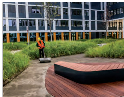
Kompleks biurowy Business Garden, Wrocław