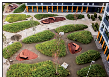
Kompleks biurowy Business Garden, Wrocław