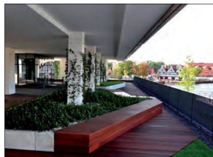
Osiedle Brabank, Gdańsk