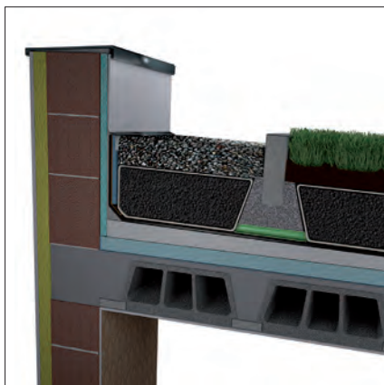
Zielony dach retencyjny z izolacją termiczną (wełna mineralna, EPS, XPS) i warstwą drenażową z Leca® KERAMZYTU

Leca® KERAMZYT może być stosowany w różnego typu dachach np. klasycznych, gdzie izolacja termiczna znajduje się pod szczelną hydroizolacją oraz w tzw. odwróconych, gdzie termoizolacja układana jest na hydroizolacji. Jako materiał termoizolacyjny Leca® KERAMZYT może przenosić większe obciążenia niż innego typu płytowe izolacje termiczne.