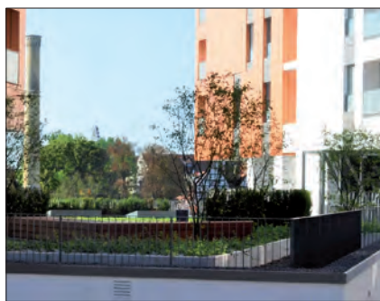
Osiedle Brabank, Gdańsk

Na stronie internetowej leca.pl/kalkulatory/kalkulator-dachy-zielone/ można wypróbować kalkulator dla dachów zielonych.