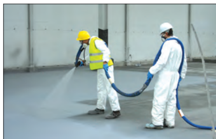
Aplikacja systemu Almacoat na powierzchni hali przemysłowej