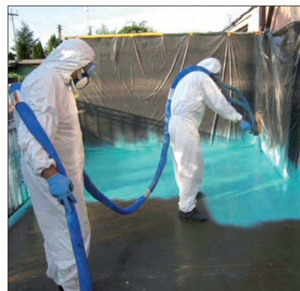
Nakładanie systemu Almacoat na tarasie

Bardzo dobra przyczepność do podłoża, brak łączeń na całej izolowanej powierzchni oraz „dopasowanie się” izolacji do kształtu podłoża, na którym jest nakładana izolacja to dodatkowe korzyści tej technologii.