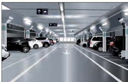
Almacoat jako izolacja betonowych posadzek parkingów i innych obiektów