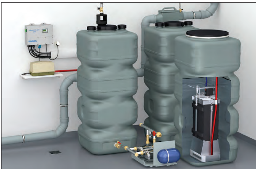
Instalacja przetwarzania wody szarej

Woda pochodząca z prysznica, wanny i umywalk odprowadzana jest oddzielnymi rurami kanalizacyjnymi do zbiornika, gdzie jest oczyszczana bez dodatków chemicznych. Szara woda