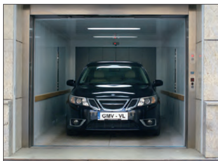
Dźwig samochodowy VL®