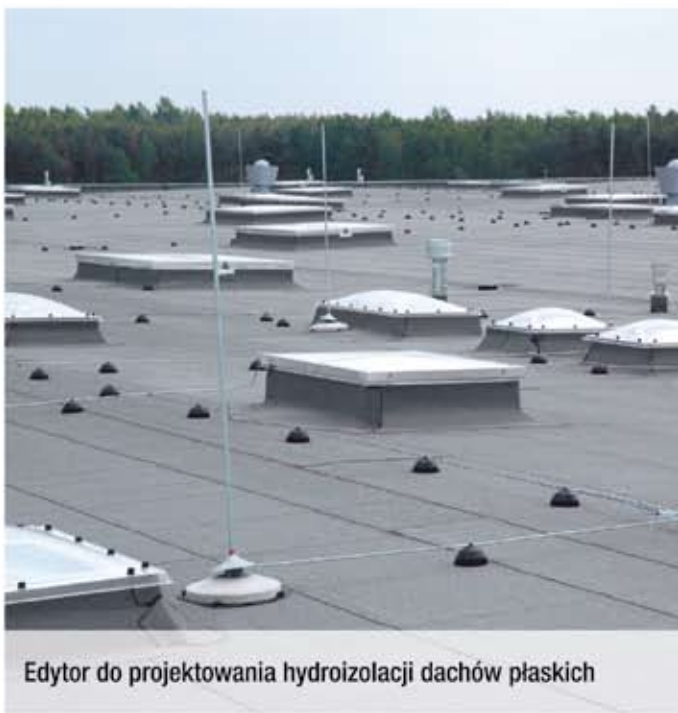
Edytor do projektowania hydroizolacji dachów płaskich