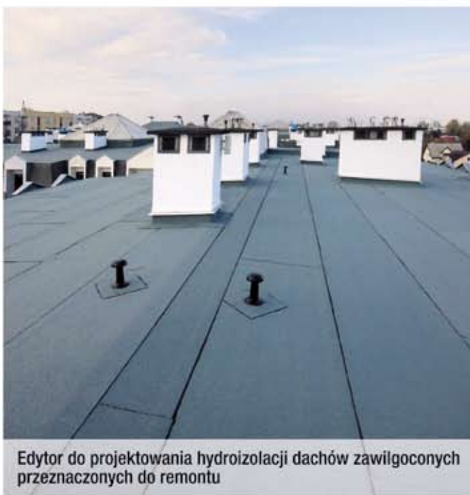
Edytor do projektowania hydroizolacji dachów zawilgoconych przeznaczonych do remontu