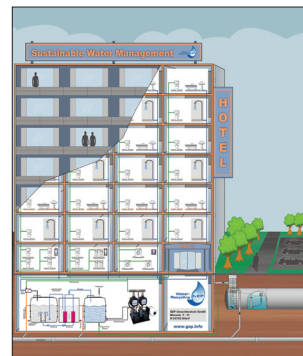
System przetwarzania i wykorzystania wody szarej

Wszystkie instalacje wody szarej niezależnie od wielkości, wyposażone są w filtry z membraną biologiczną oraz filtry MicroClear. Instalacje te